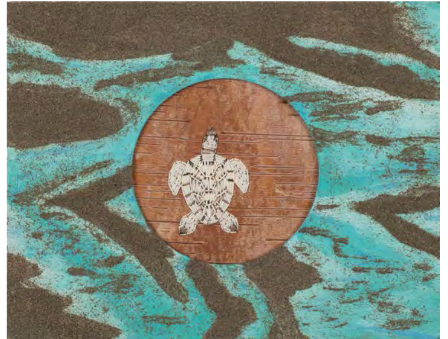
TIM HOGAN Hannah's Journey (Le voyage d'Hannah) , 2017 Sand, acrylic, quills, wood, birch bark / Sable, acrylique, puiquants de porc-épic, bois, écorce de bouleau 28 x 35,5 cm