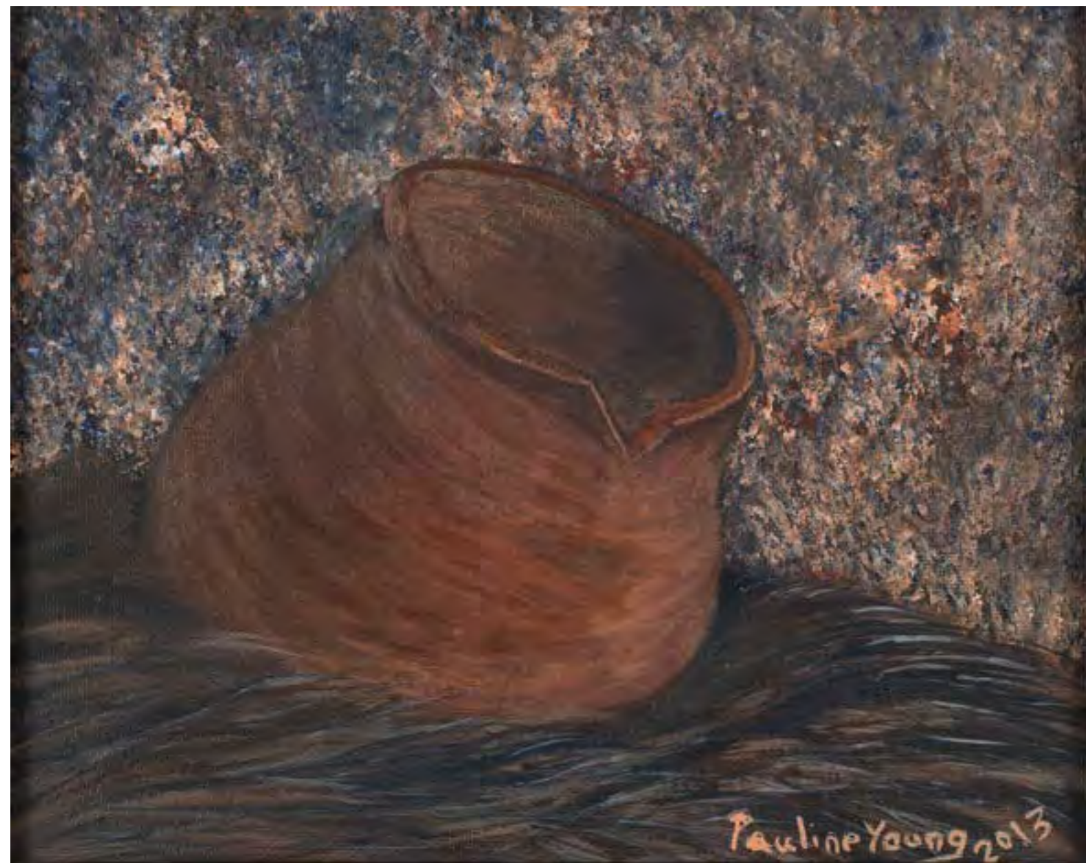
Mi'kmaq Clay Pot (Pot en argile micmac), 2013 Acrylic on canvas / Acrylique sur toile 20 x 15 cm