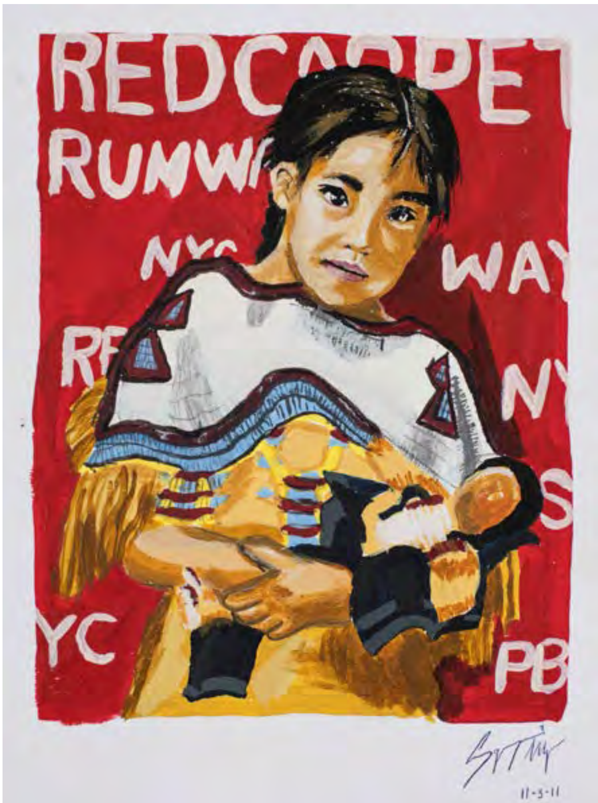
SGOAGANI WECENISQON Red Carpet (Tapis rouge), 2017 Acrylic on paper / Acrylique sur papier 45 x 30 cm