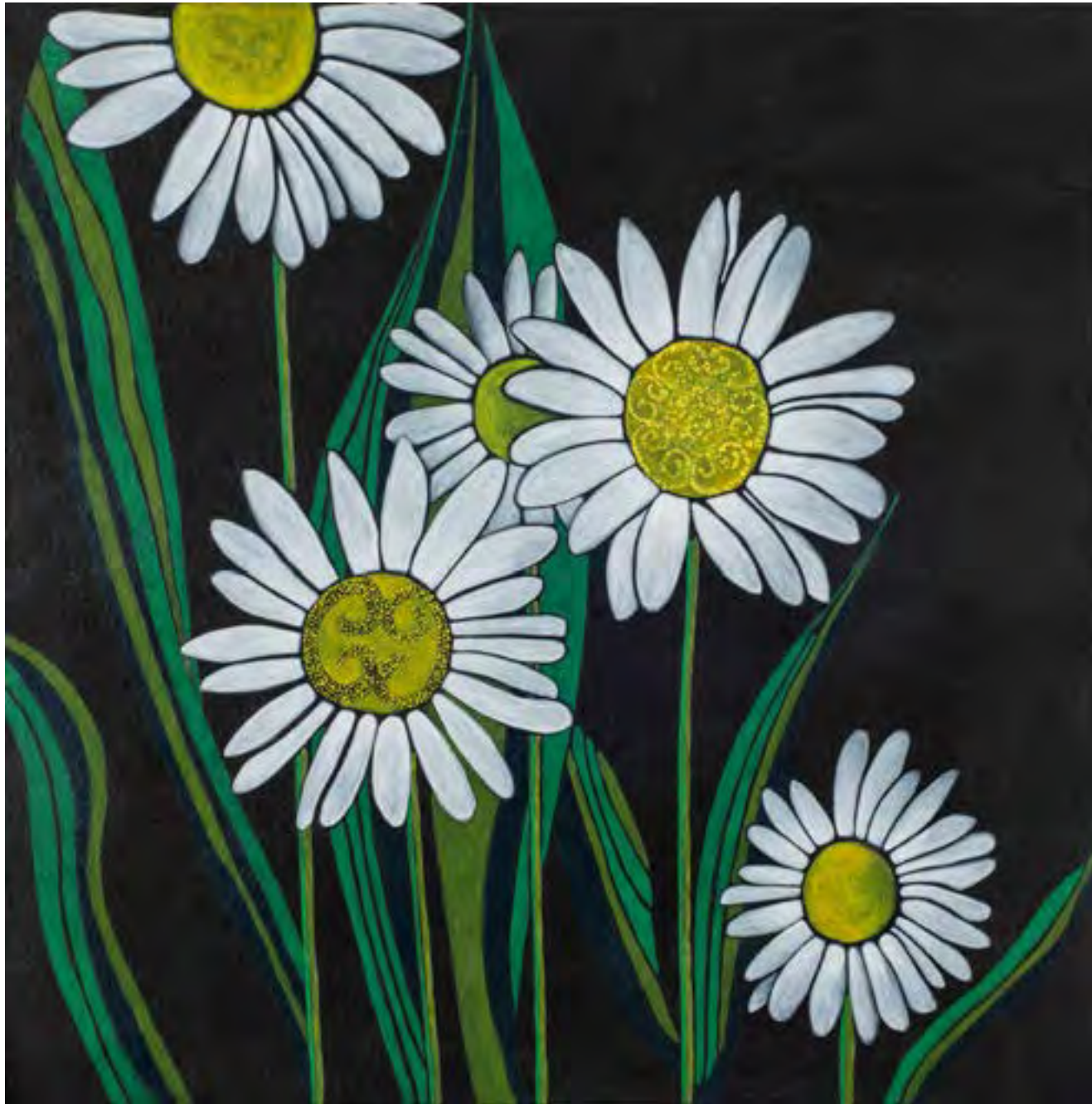
FRANCINE FRANCIS Daisies (Marguerites) , 2017 Acrylic on canvas / Acrylique sur toile 61 x 61 cm